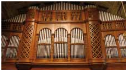
Steinmeyer Orgel, Christuskirche